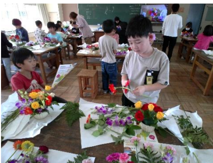
静岡県産のさまざまな彩りの花を生けていきます。

静岡県は多彩で高品質な全国屈指の花の生産県であり、一年を通して花を楽しむ名所や花に関わる人材も豊富です。