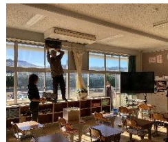
全教室のエコフィルターを洗浄