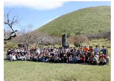
伊豆最大のスコリア丘「大室山」と記念撮影

ジオパーク見学を通して、「城ヶ崎海岸」は、約4000年前に噴火した大室山の溶岩流が海に流れ込み、海水に冷やされたことで現在のような海岸地形になったことを学びました。また、「大室山」は、伊豆東部火山群の中で最大のスコリア丘(吹き上げられたマグマが冷え、降り積もってできた山)であることなどを学びました。