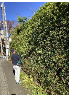
生け垣の草木を刈り取り

保護者の皆様の協力の下、PTA奉仕作業を行いました。男性は、国道沿いの生け垣手入れと側溝の清掃作業を中心に行いました。女性は、校舎内の清掃を行いました。側溝は、手作業で格子状の重いふたを持ち上げ、溝の中の泥を取り除いていきました。校舎内は、窓ガラスや各階の流しをきれいに磨きあげることを中心に作業を行い、すっきりときれいになりました。短時間で効率よく作業を進め、校舎内外の整備を終えることができました。PTA奉仕作業への皆様の御協力ありがとうございました。