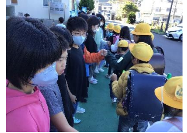
お辞儀をしながら「グータッチ」

学校の正門前などには地域の方々が立ち、玄関前や校舎内は児童会役員に加えて、多くの児童が自主的に集まり、「おはようございます」という元気なあいさつとともに、お辞儀をしながら「グータッチ」をしている姿が見られました。明るくにぎやかな朝のあいさつ運動となりました。