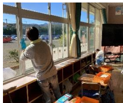
教室の窓がきれいに