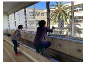
流し奥の窓ガラスもすっきり