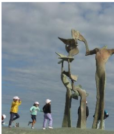
なぎさ公園で海を見ながら(1年生)

伊東小学校が開校してから初めての遠足が行われました。前日までの暖かさとは打って変わり、寒風が吹きすさぶ中ではありましたが、子どもたちはたくさん歩き、友達と一緒に弁当を食べたり、学年でレクリエーションをしたりと楽しい1日を過ごすことができました。なお、4年生は保護者ボランティアの方々がウォークラリーのチェックポイントに立ち、班の通過を確認したり、指令を出したり協力してくださいました。寒い中、本当にありがとうございました。