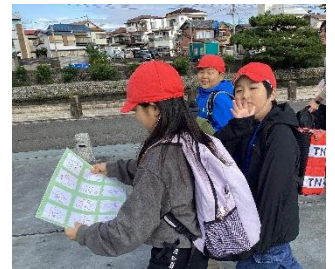
コマ地図を見ながら方向確認(4年生)