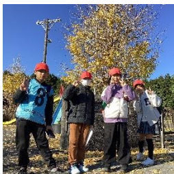
班で協力 ウォークラリー