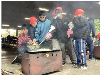
自分たちで作った焼きそばは格別の味です

延期になっていた5年生の自然教室ですが、宿泊先を国立中央青少年交流の家(御殿場市)に変更し計画を立て直して無事に実施することができました。