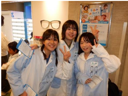
楽しみながら仕事やサービスを体験「キッズニア」

6年生が東京方面へ修学旅行に行ってきました。1日目は、キッズニア東京で体験活動を行い、夕方に東京スカイツリーを訪れました。2日目は、浅草とお台場で班別研修を行い、最後に日本の政治の中心である国会議事堂を見学しました。6年生の児童にとって、小学校生活の大きな思い出となる修学旅行となりました。