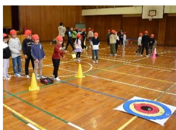
伊東分校の児童とレクリエーションで交流(3年生)