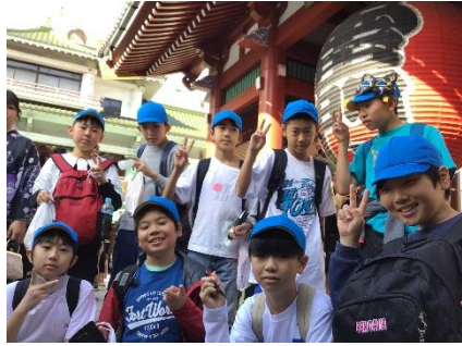
浅草のシンボル「雷門(風雷神門)」