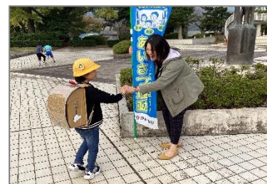
笑顔でにっこり “グータッチ”

学校の正門前などには地域の方々が立ち、玄関前や校舎内は児童会役員に加えて、多くの児童が自主的に集まり、「おはようございます」という元気なあいさつとともに、にっこりと笑顔で「グータッチ」をしている姿が見られました。明るくにぎやかな朝のあいさつ運動となりました。