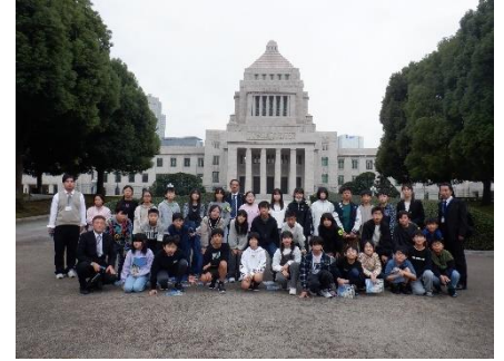
国の政治などについて話し合う「国会議事堂」