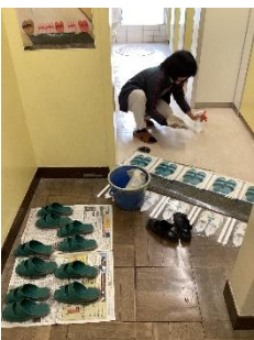
トイレの床がきれいに

保護者の皆様の協力の下、PTA奉仕作業を行いました。男性は、側溝の清掃作業と草木の手入れを中心に行いました。女性は、校舎内の清掃を行いました。側溝は、手作業で格子状の重いふたを持ち上げ、溝の中の泥を取り除いていきました。校舎内は、窓ガラスや各階の流しをきれいに磨きあげることを中心に作業を行い、すっきりときれいになりました。短時間で効率よく作業を進め、校舎内外の整備を終えることができました。PTA奉仕作業への皆様の御協力ありがとうございました。