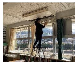
全教室のエアコンフィルターを洗浄