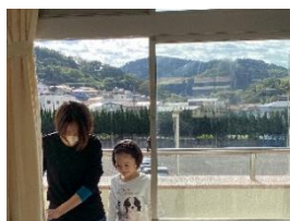
教室の窓がすっきり