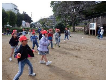
伊東公園で「だるまさんがころんだ」(2年生)