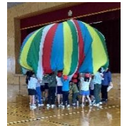
交流種目もあります