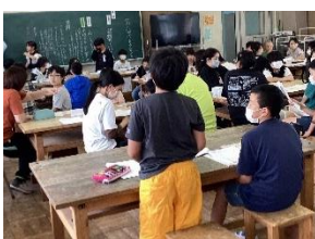
意見を伝える方も聞く方も真剣で、よい表情

今年度、初めての代表委員会が開催されました。3年生以上の学級委員、委員長、児童会役員総勢約50人が、6校時に図工室に集まり、児童会役員の司会で話し合い活動を行いました。