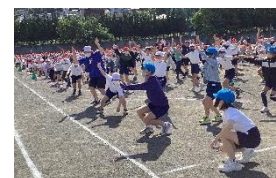
全校でダンスを踊ります

いよいよ、明日は運動会です。演技と競技で練習してきた成果を発揮して精一杯の力を出し切る姿を期待しています。