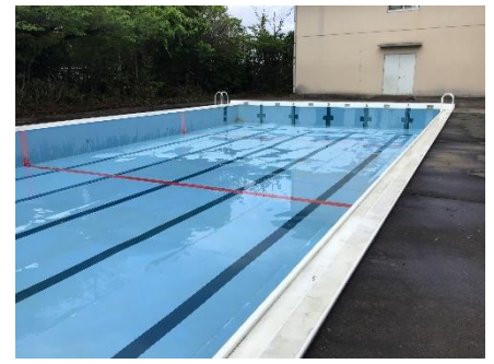
きれいになりました！大勢でやると早い！