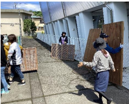
目隠し用の木製パネルをフェンスに取り付けます

Hi!アプリを活用して募集したところ大勢の方が応募してくださいました。当日は、予想以上の降雨となったため、急遽、天気が回復する午後の作業に変更させていただきました。23名の保護者の皆様にご協力いただきました。手際よく作業が進み、予定していた時間よりも早く、プールや更衣室、トイレ等をきれいに清掃することができました。ありがとうございました。プール開きは6月5日(水)です。