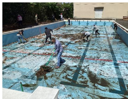
落ち葉や泥を集めて掃き出します