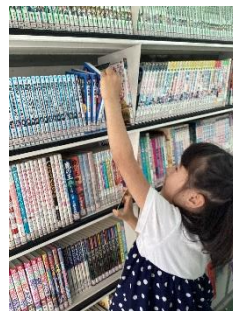
「あっ、知っている本だ。」

伊東市立図書館では、市内小学校などを巡回して本の貸し出しを行う移動図書館「ともだち号」を運行しています。