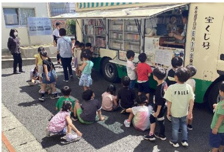
ともだち号で本を借りるのが楽しみになりました